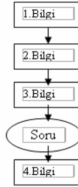
Çizim 2: Doğrusal Olarak Hazırlanmış Yazılımdaki Dersin Genel Yapısı